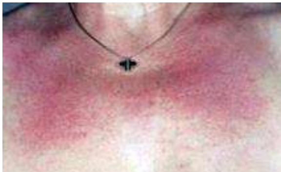
Grade 2 Érythème modéré à intense

Afin de prévenir au mieux ces lésions cutanées induites par les radiations, il est recommandé de préparer correctement sa peau en amont du traitement et d'en prendre soin durant et après celui-ci, pour éviter l'apparition d'effets tardifs.