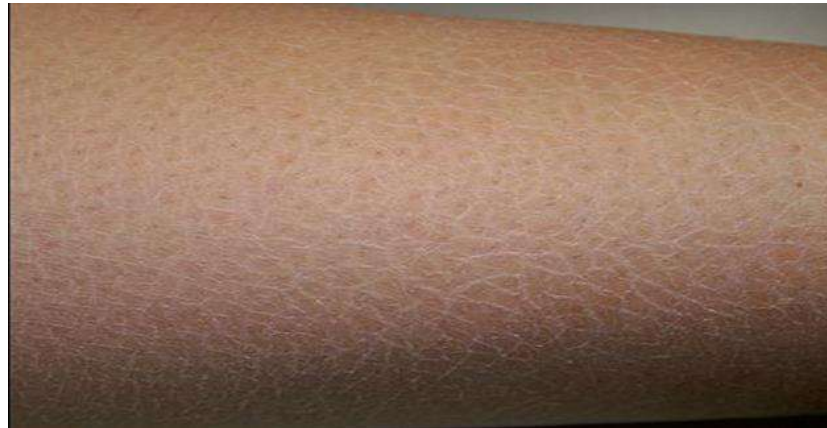
Xérose de grade 1

Certains traitements de chimiothérapies peuvent provoquer une fragilité et un inconfort cutané important, pouvant aller jusqu'à la « Xérose ». Prendre soin de sa peau de manière anticipée avec des protocoles spécifiques permet de mieux prévenir ces symptômes et ces désagréments. Les recommandations suivantes optimisent le rôle protecteur et la fonction barrière de la peau.